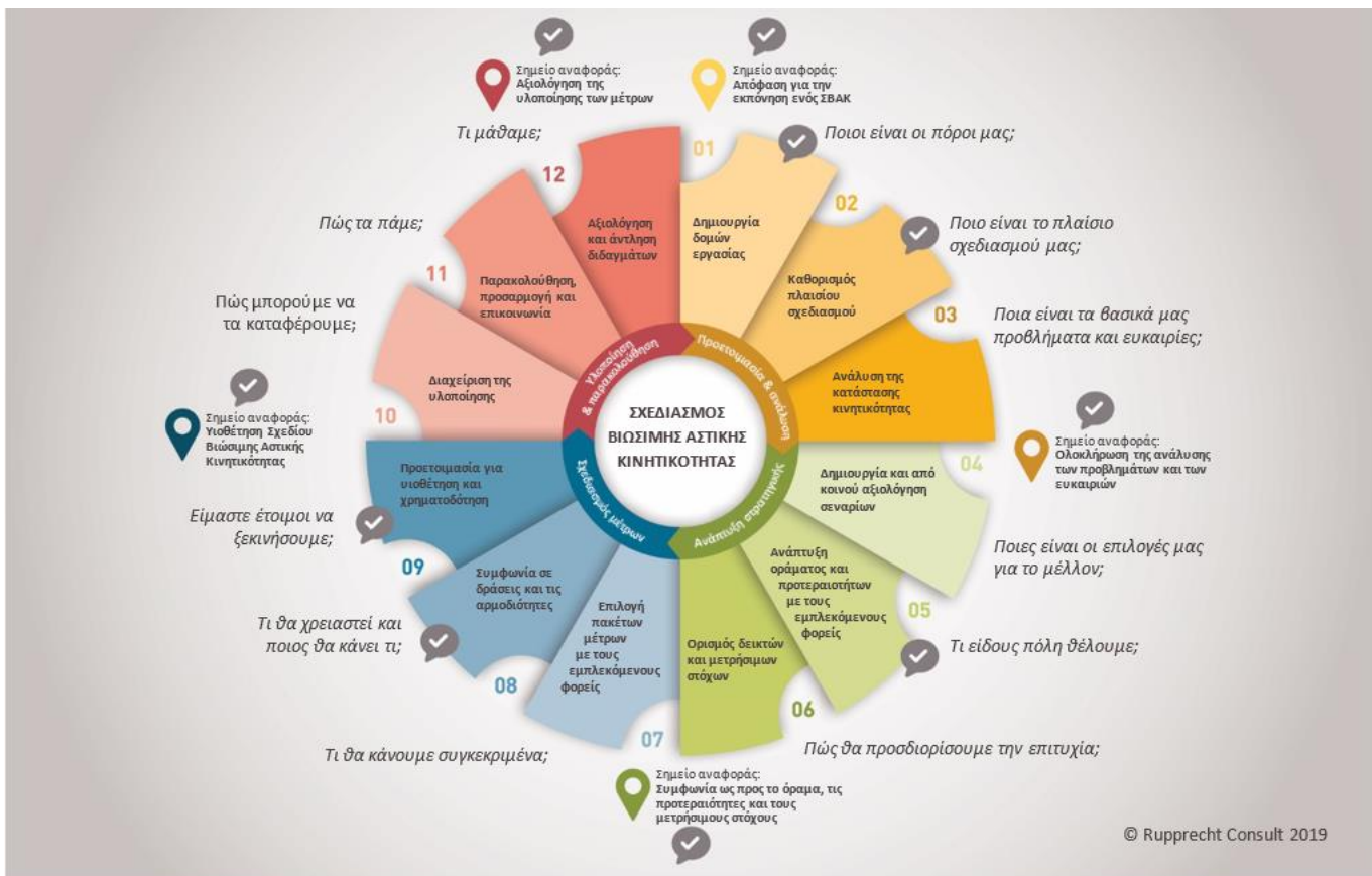
Σχήμα 1: Τα 12 βήματα του Σχεδιασμού Βιώσιμης Αστικής Κινητικότητας (2η έκδοση) – Επισκόπηση για τον υπεύθυνο λήψης αποφάσεων

Αυτή είναι, φυσικά, μια εξιδανικευμένη και απλουστευμένη αναπαράσταση μιας πολύπλοκης διαδικασίας σχεδιασμού. Σε ορισμένες περιπτώσεις, τα βήματα μπορούν να εκτελεστούν σχεδόν παράλληλα (ή ακόμη και να επανεξεταστούν), η σειρά εργασιών μπορεί να προσαρμοστεί περιστασιακά σε συγκεκριμένες ανάγκες ή μια δραστηριότητα μπορεί να παραλειφθεί εν μέρει επειδή τα αποτελέσματά της είναι διαθέσιμα από άλλη ενέργεια του σχεδιασμού. Ο κύκλος ΣΒΑΚ έχει καθιερωθεί ως ένα χρήσιμο εργαλείο καθοδήγησης που συμβάλλει στην οργάνωση και την παρακολούθηση της διαδικασίας σχεδιασμού.